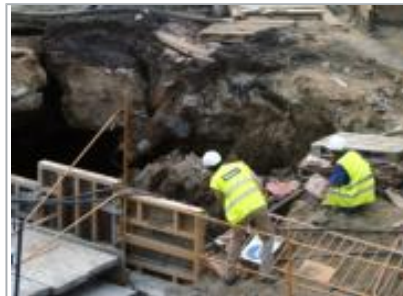
Dos operarios observan el socavón unos minutos después de producirse. J. M. SERRANO

La información, como casi siempre en estos casos, fue la primera víctima de la situación. «Aquí no pasa absolutamente nada», respondía un operario cuando se le solicitaba alguna información de lo ocurrido. También el encargado de obra se negaba a dar ningún tipo de información, lo que facilitaba aún más que cada vecino diera su propia versión de lo ocurrido. Muchos de ellos sacaban sus fotos desde las ventanas de casa. «Yo llevo meses sacando foto de todo porque no me fío ya de nada de lo que dicen»,