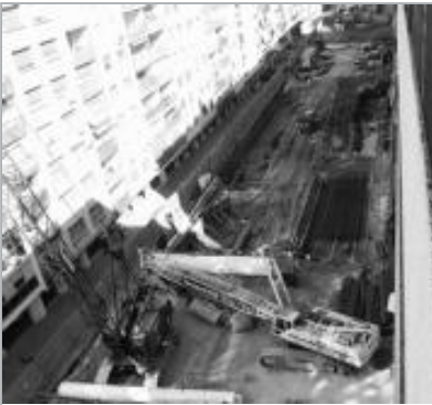
Los retrasos en Los Remedios afectan a la puesta en marcha de la tuneladora.

SEVILLA. La concesionaria del Metro pagaría hasta 76.000 euros por día de retraso en la fecha prevista para la puesta en marcha de este transporte, junio de 2006, si las causas de ese retraso fuesen imputables a ella. Así lo establece el contrato suscrito en su día entre la Consejería de Obras Públicas y la unión de empresas que conforma la concesionaria, que exactamente fija un recargo de 0,12 euros por cada 600 euros del presupuesto de inversiones, que se sitúa en 383 millones de euros. No obstante, Obras Públicas mostró ayer su confianza en «la solvencia, la capacidad técnica y experiencia» de las empresas que conforman la concesionaria -Sacyr, Dragados, gea 21, Caf, Transportes urbanos de Zaragoza y Rus- para solventar los retrasos acumulados hasta el momento - que la constructora de la concesionaria llega a cifrar en seis meses- y conseguir que el Metro empiece a funcionar en la fecha establecida en el contrato.