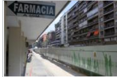
Las obras del Metro han llevado el caos comercial a República Argentina.