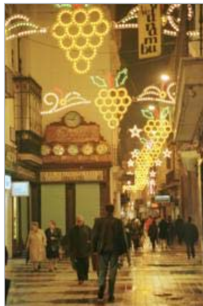
La calle Sierpes, adornada durante la Navidad.

Afirma que esa es la «única manera» con la que el sector puede «presionar» al Ayuntamiento, a la vez que manifestó que para este año se ha acordado una solución, porque «faltan pocos días para la Navidad y tampoco podemos jugar con los intereses de los comerciantes». «Queremos que se alumbren las calles, sobre todo las comerciales», dijo.